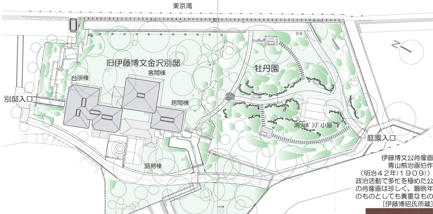
伊藤博文公肖像画 青山熊治画伯作

(明治42年(1909)) 政治活動で多忙を極めた公の肖像画は珍しく、最晩年のものとしても貴重なもの [伊藤博昭氏所蔵]