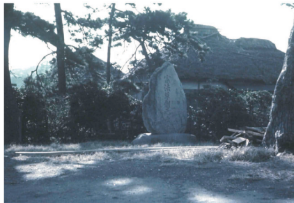
昭和37年(1962)に解体撤去された台所棟玄関の外観写真